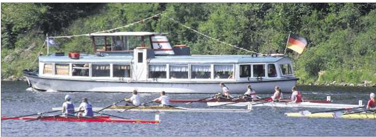
Über 170 Rennen wurden am Wochenende auf der reizvollen Distanz zwischen Heinrichstein und dem Saaldorfer Bootshaus zur 42. Bad Lobensteiner Ruder-Regatta gestartet.